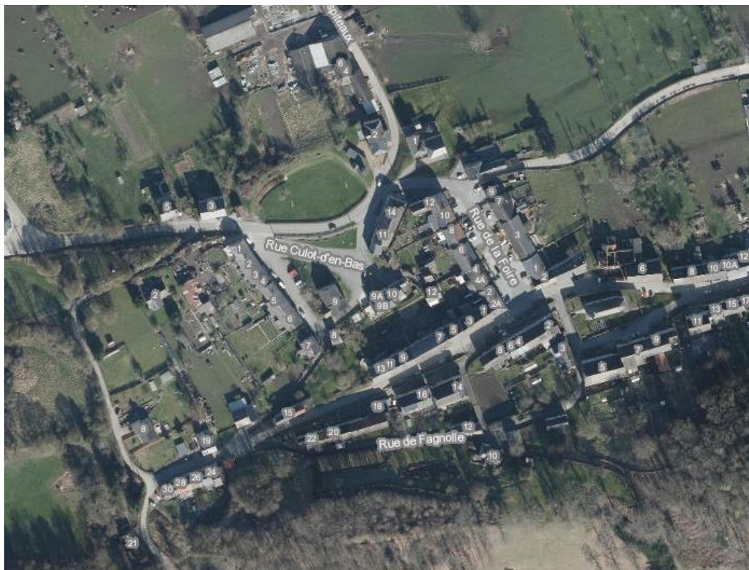
Village de Fagnolle

Le projet se divise en plusieurs thématiques dont les aménagements sont décrits ci-après.