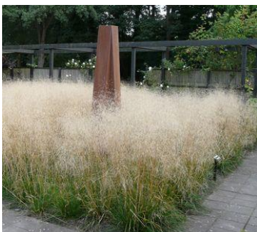
Végétalisation de type bucolique : Graminées (légèreté et transparence)

De plus, une haie de 160 m sera plantée au nord du site.