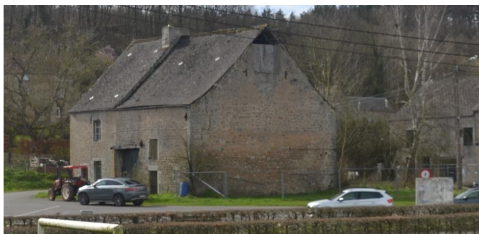
Bâtisse abandonnée

Une bâtisse abandonnée se situe de plus rue Culot d'en Bas, au sud de la place. Son état de dégradation est très important et pose des problèmes de sécurité. Les autorités communales ont dès lors pris la décision de faire démolir ce bâtiment.