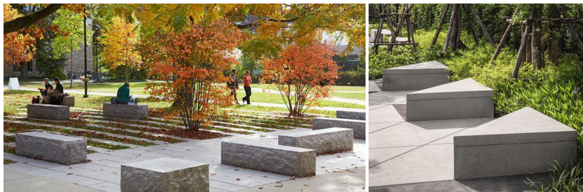
Exemples d'aménagement d'espace de détente végétalisé

Une partie du site pourra également être aménagée à la manière d'un petit parc où la végétation sera importante et participera au caractère champêtre du village. À cet endroit, du mobilier urbain pourra être prévu afin d'offrir une zone de détente, ainsi qu'une petite plaine de jeux entourée de végétation. Les goals de foot actuellement présents seront conservés.