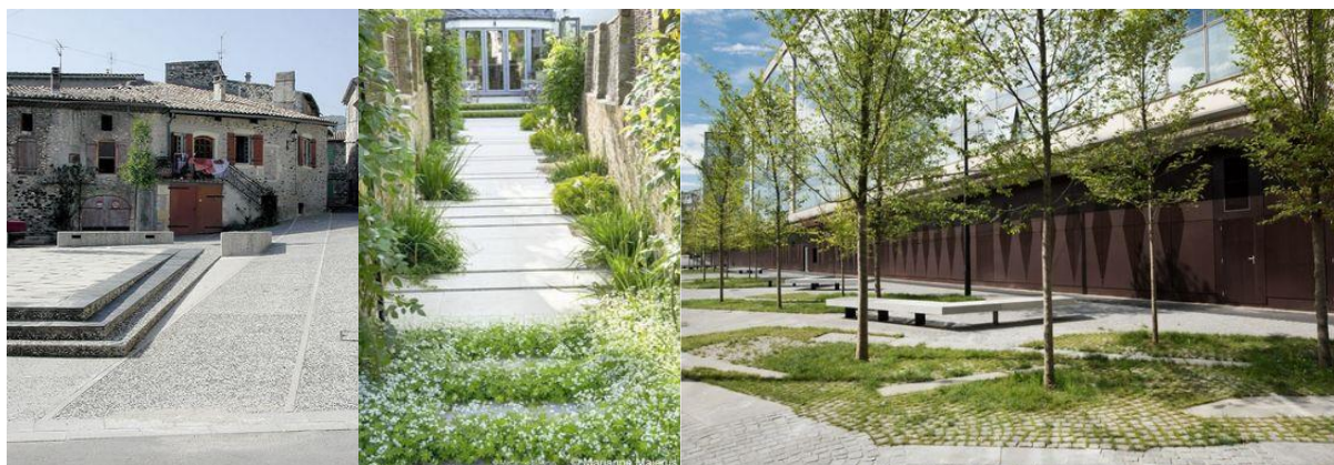
Exemple de matériaux et ambiance champêtre à créer