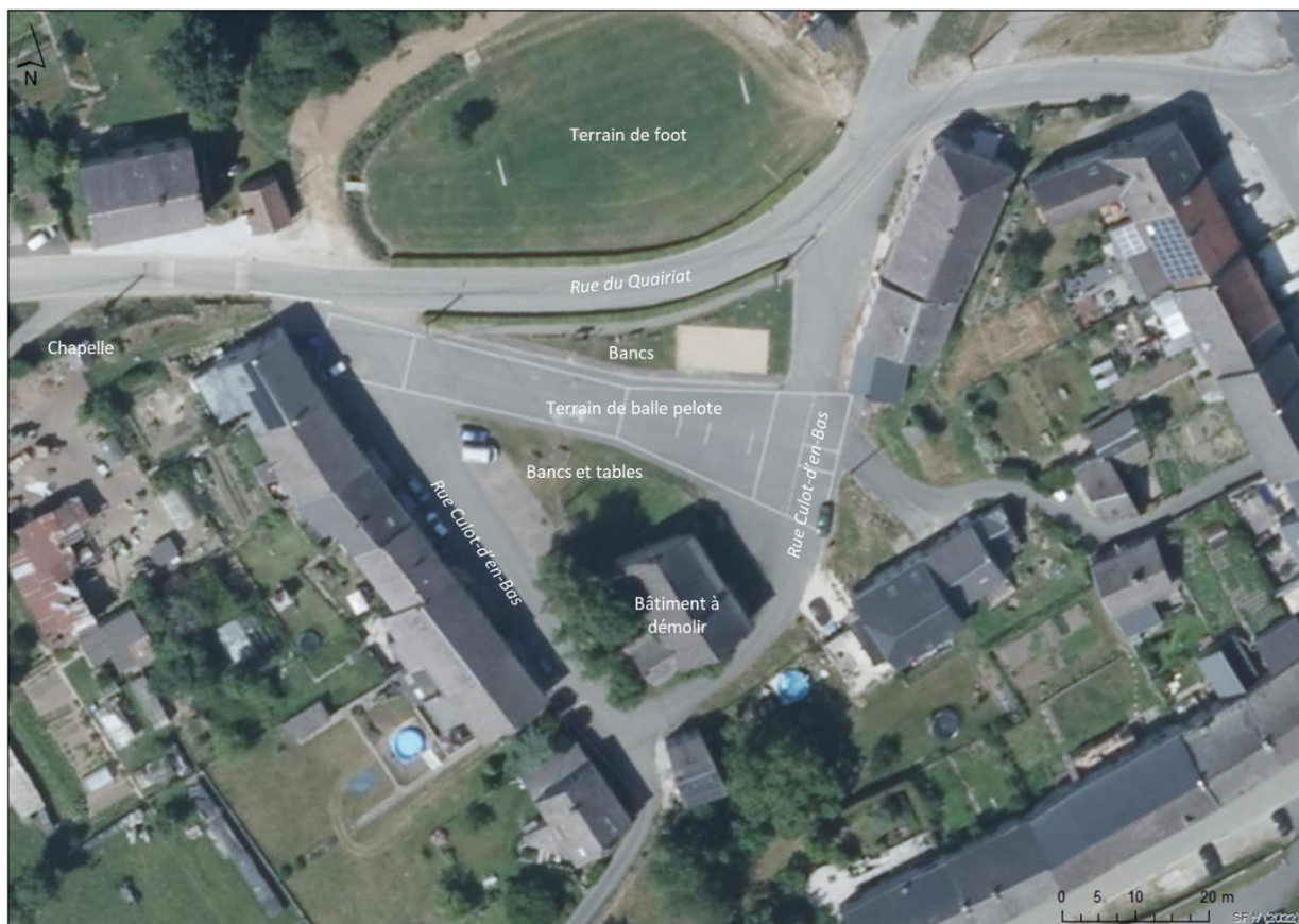
Place de Fagnolle (Orthophoto 2022)