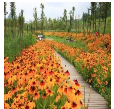
Végétalisation de type bucolique : Massifs fleuris monospécifique (facilité d'entretien)

Le schéma d'intention ci-dessous résume les propositions d'aménagement décrite ci-dessus :