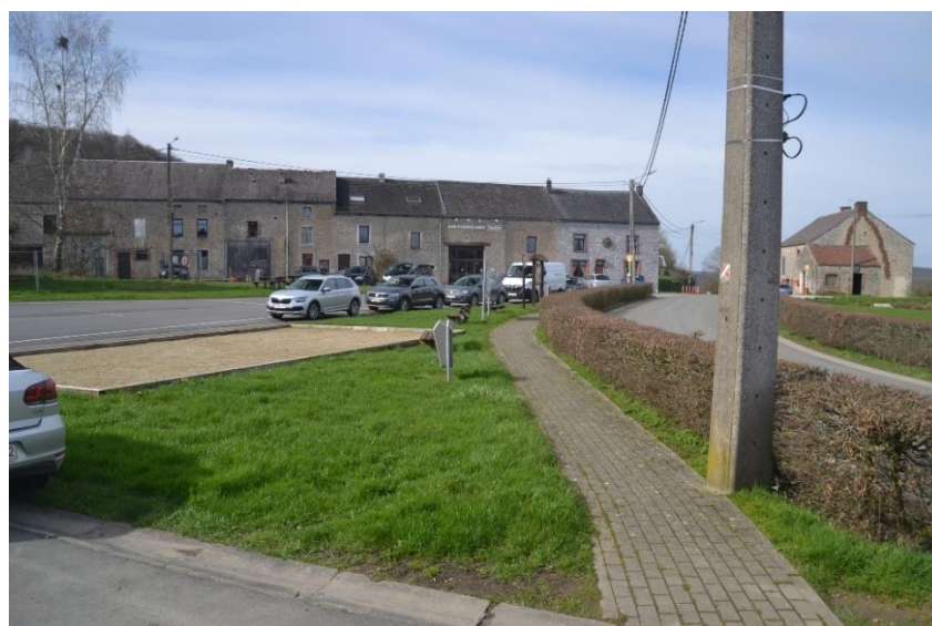
Reportage photos