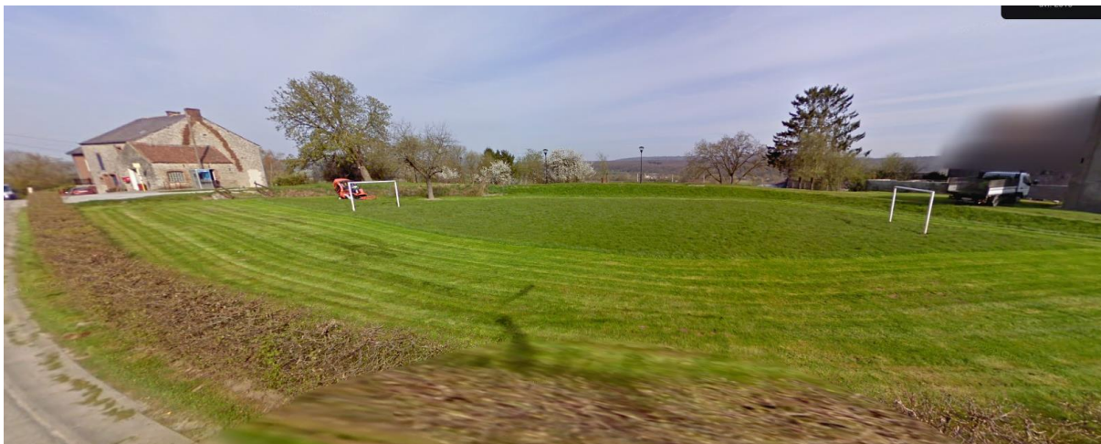
Terrain de foot au nord de la place

De manière générale, bien que plusieurs aménagements y soient déjà présents, la place manque de convivialité au vu de la grande zone minéralisée en son centre, non délimitée des voiries, ce qui en diminue le sentiment de sécurité et de convivialité.