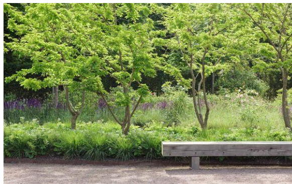
Végétalisation de type bucolique : Arbres en cépée (rappel verger, transparence)